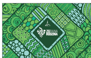
Wzór nr 5

Proszę o wysyłkę karty na adres korespondencyjny