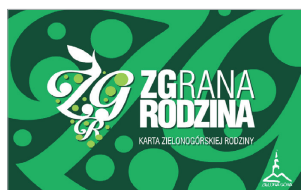
Wzór nr 1