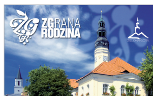
Wzór nr 2