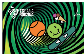
Wzór nr 3